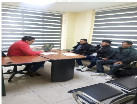
Fotografía N° 03

El cumplimiento de la ordenanza de estacionamiento de vehículos públicos y particulares en el cantón Alausí es indispensable para garantizar una movilidad eficiente, segura y equitativa. La articulación entre autoridades locales y ciudadanía permitirá consolidar una cultura de respeto a la normativa, optimizando el uso del espacio público y contribuyendo al desarrollo sostenible y ordenado del cantón.