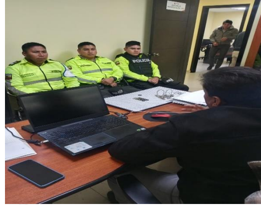
Fotografía N° 02