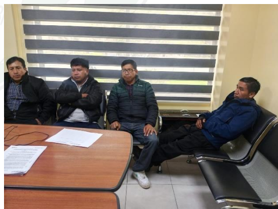
Fotografía N° 04