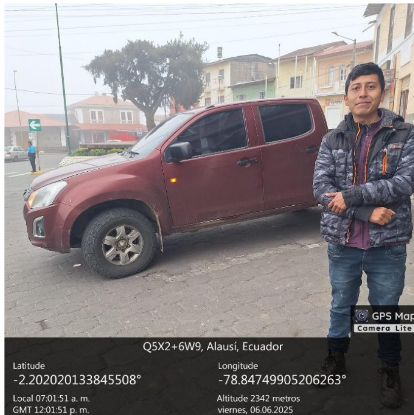
Anexo: 1 Convocatoria Al Personal Medico en Alausí

Altitude 2342 metros viernes, 06.06.2025