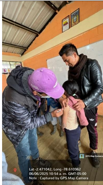
Anexo: 5 Vacunación a estudiantes de la Unidad Educativa Guangras