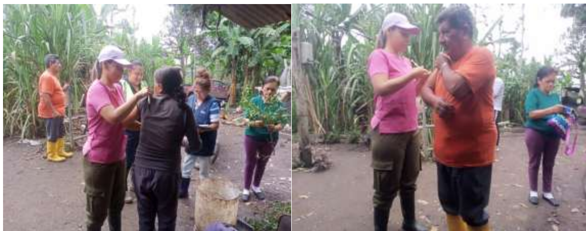
CAMPAÑA DE VACUNACION CONTRA LA INFLUENZA