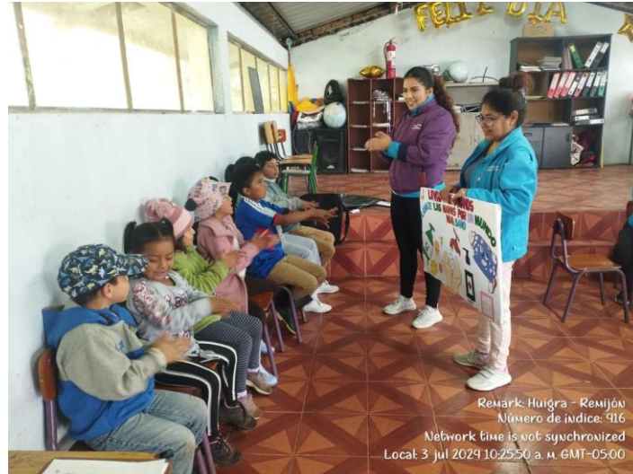
CHARLA SOBRE LAVADO DE MANOS