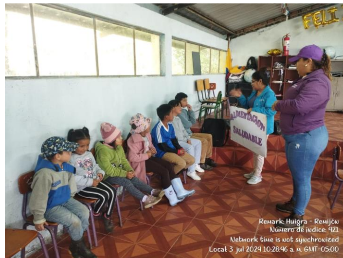
CHARLA EDUCATIVA SOBRE ALIMENTACIÓN SALUDABLE