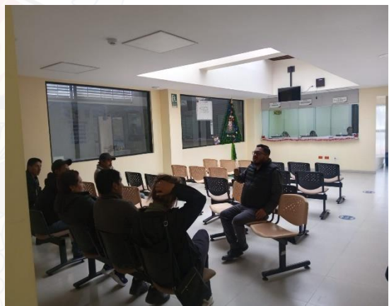
Fotografía N° 04