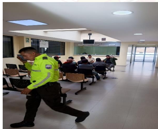
Fotografía N° 03