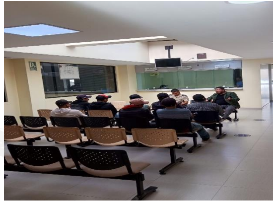
Fotografía N° 02