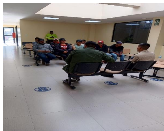
Fotografía N° 01