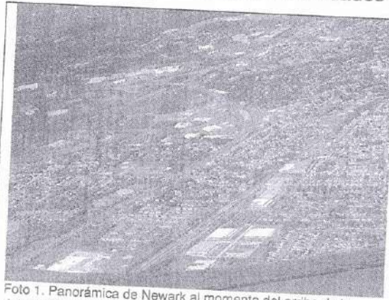
Foto 1. Panorámica de Newark al momento del arribo de la delegación del GADMCA a Newark EEUU.