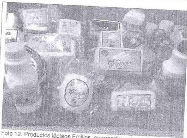
Foto 12. Productos lácteos Emilios, emprendimiento en la comunidad de Pagma, Alausí, en la ceremonia para la firma del acuerdo de ciudades hermanas entre Newark EEUU y Alausí Ecuador. Newark 18 de may 2021.