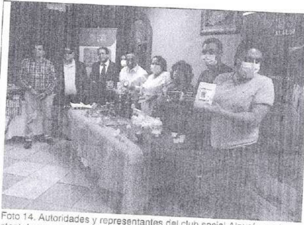
Foto 14. Autoridades y representantes del club social Alausí, en el stand de emprendimientos del cantón Alausí, en la ceremonia para la firma del acuerdo de ciudades hermanas entre Newark EEUU y Alausí Ecuador. Newark 18 de may 2021.