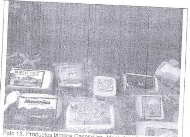
Foto 13. Productos lácteos Cascarillas, Montañez, Benitez emprendimientos de comunidades del cantón Alausí, en la ceremonia para la firma del acuerdo de ciudades hermanas entre Newark EEUU y Alausí Ecuador. Newark 18 de may 2021.