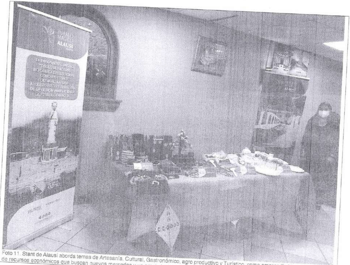
Foto 11. Stant de Alausí aborda temas de Artesanía, Cultural, Gastronómico, agro productivo y Turístico, como emprendimientos generadores de recursos económicos que buscan nuevos mercados y un precio justo para los diferentes eslabones de las cadenas respectivas